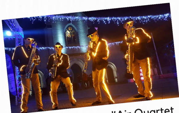
1ère partie : SaxeZ l'Air Quartet